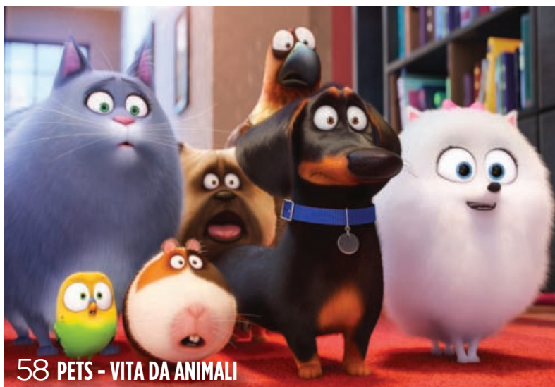
58 PETS - VITA DA ANIMALI

★★★★ OTTIMO ★★★ BUONO ★★ SUFFICIENTE ★ MEDIOCRE ★ SCARSO