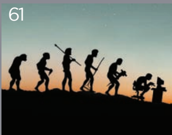
LO AND BEHOLD