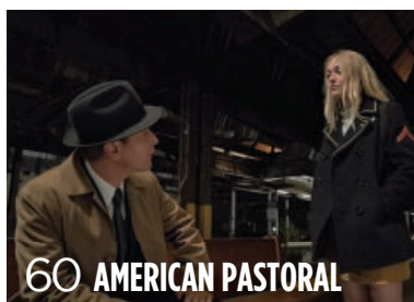
60 AMERICAN PASTORAL