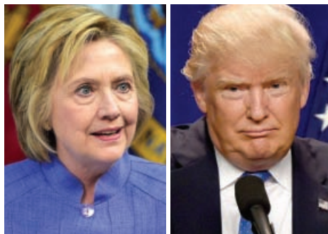
Hillary Clinton e Donald Trump: chi alla Casa Bianca?