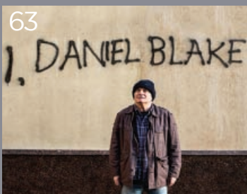
IO, DANIEL BLAKE