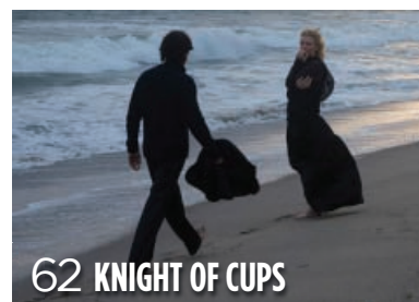
62 KNIGHT OF CUPS