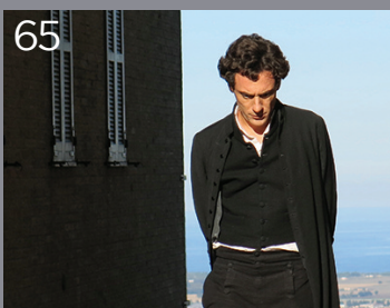
65 Il giovane favoloso