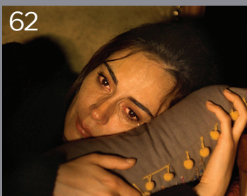
62 Il regno d'inverno