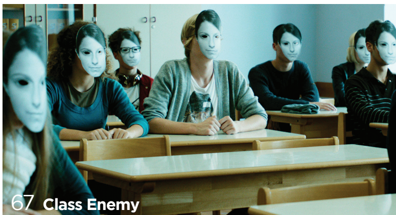
67 Class Enemy