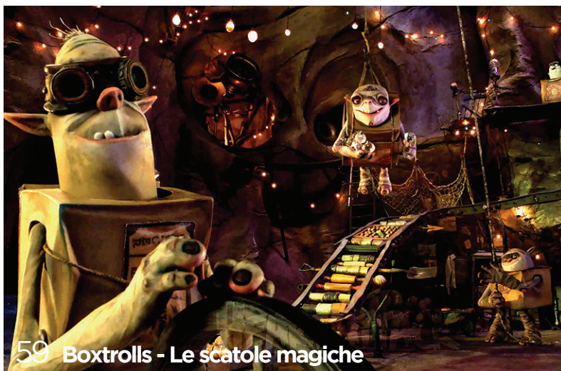
59 Boxtrolls - Le scatole magiche

★★★★ OTTIMO ★★★ BUONO ★★ SUFFICIENTE ★ MEDIOCRE ★ SCARSO