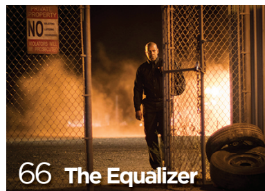
66 The Equalizer