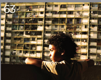
63 Pelo Malo