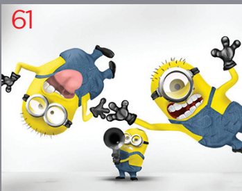
Cattivissimo me 2