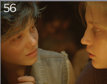
La vita di Adele