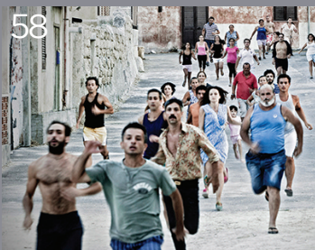
Via Castellana Bandiera