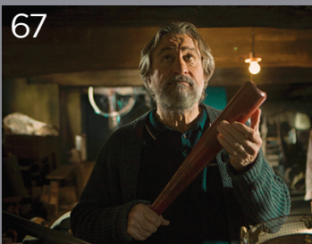
Cose nostre - Malavita