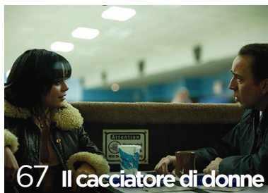
67 Il cacciatore di donne