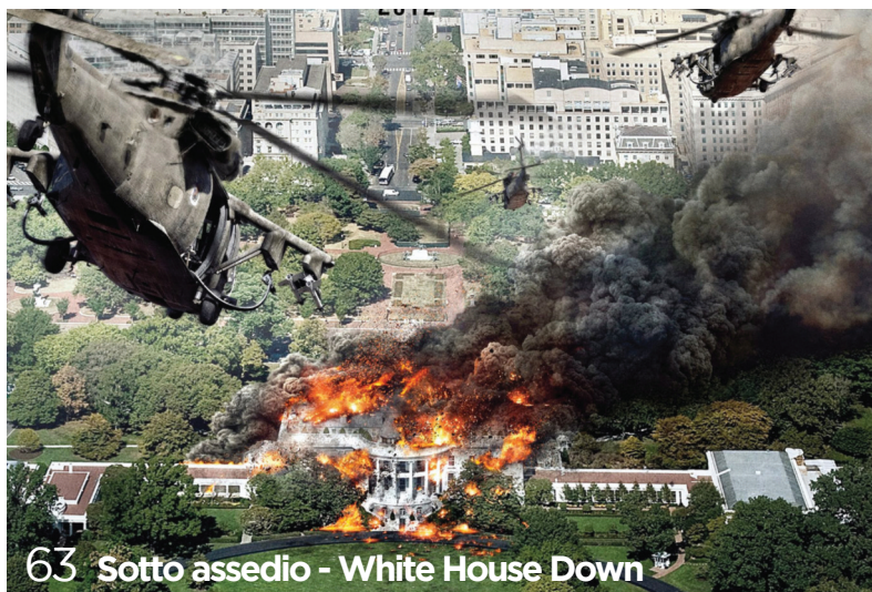
63 Sotto assedio - White House Down

★★★★ OTTIMO ★★★ BUONO ★★ SUFFICIENTE ★ MEDIOCRE ★ SCARSO