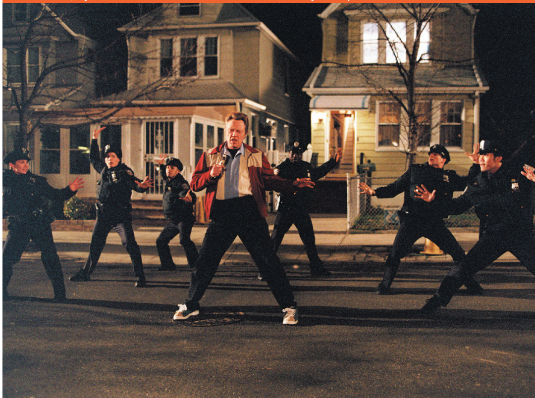
36 Christopher Walken in Romance & Cigarettes