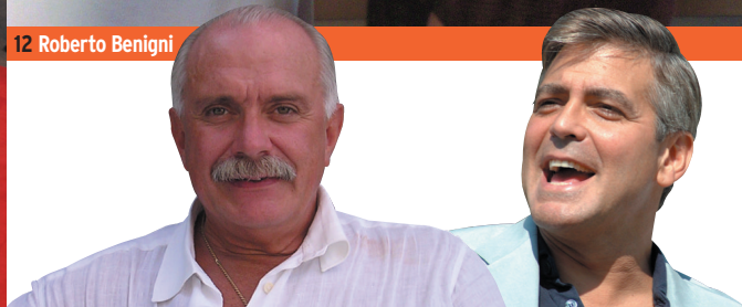
24 Nikita Mikhalkov e George Clooney: uomini contro