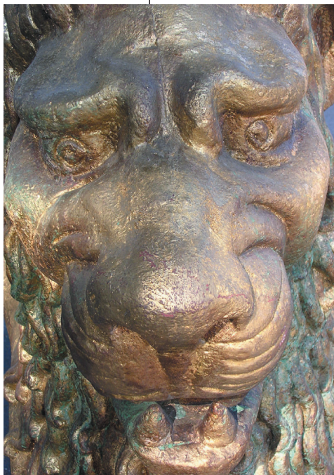
Nel segno del Leone: bilanci dal Festival e auspici per il futuro