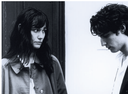
42 Les amants réguliers di Philippe Garrel