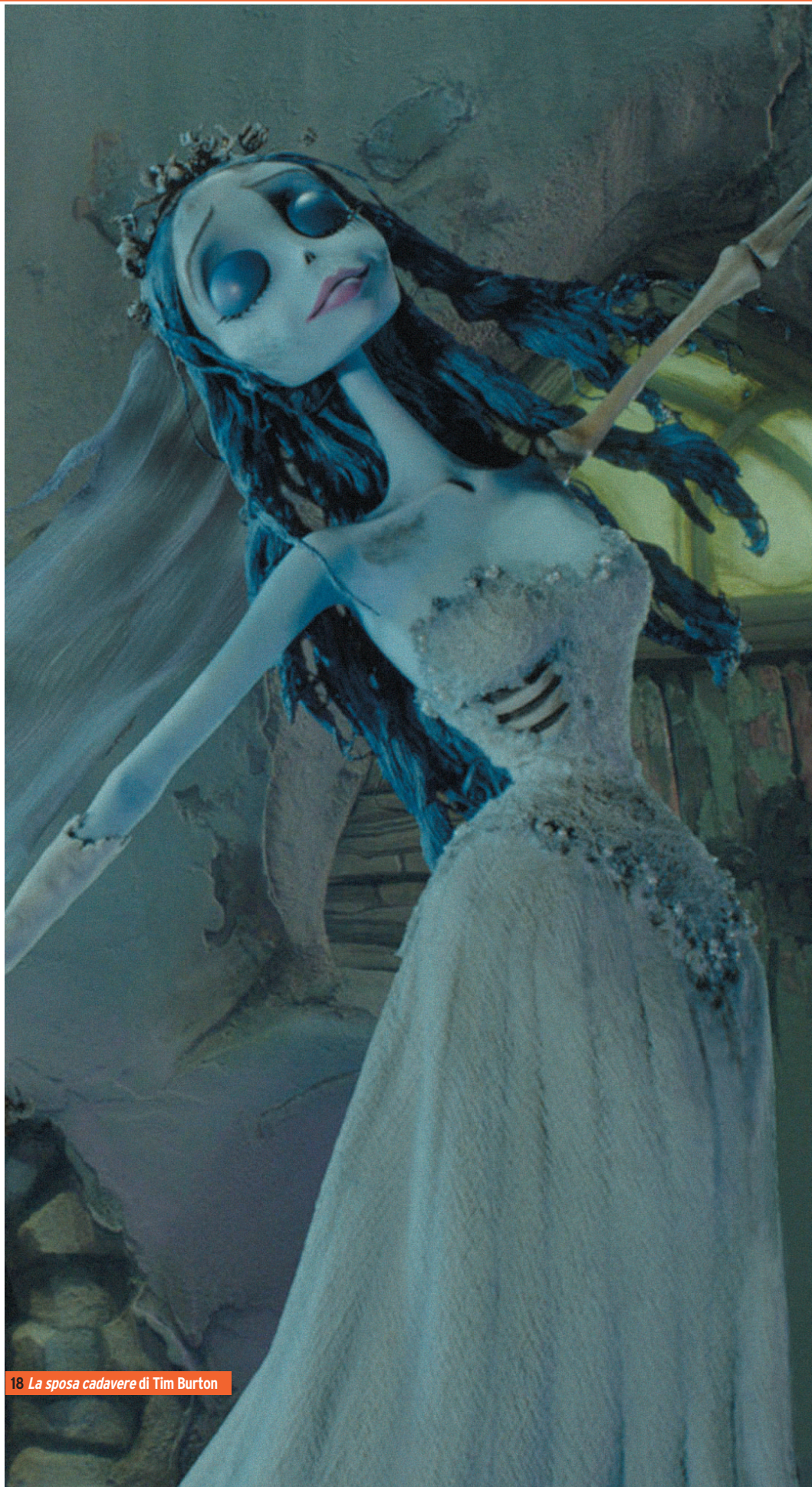
18 La sposa cadavere di Tim Burton