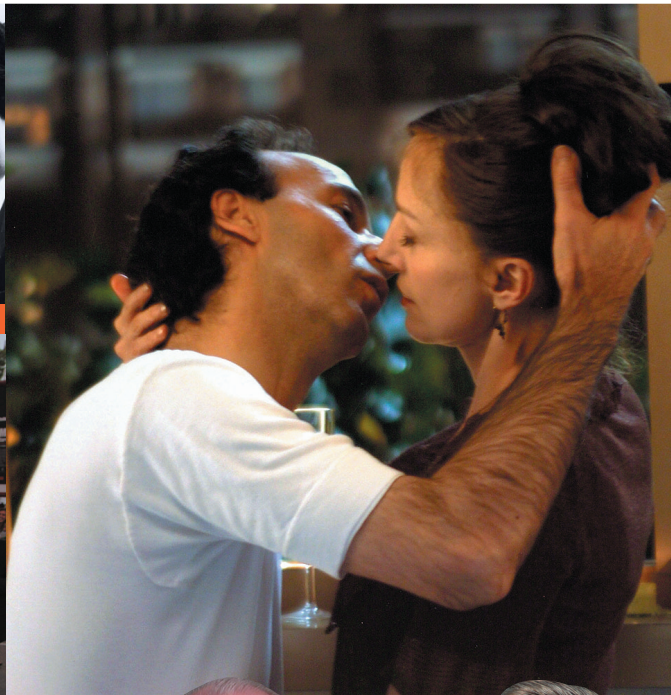
12 Roberto Benigni