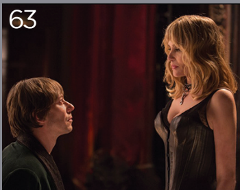
Venere in pelliccia