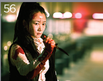
Il tocco del peccato