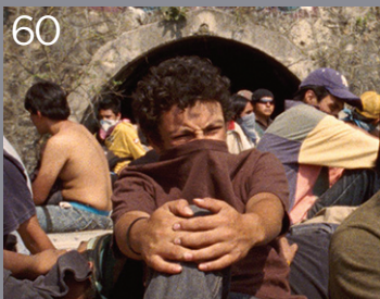
La gabbia dorata