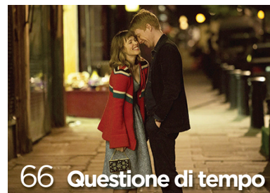
66 Questione di tempo