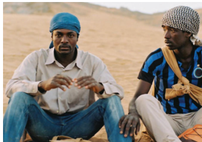
Una scena di Mediterranea

Festival di Cannes: ai film in concorso - a partire da quelli firmati da Garrone, Moretti e Sorrentino - la Rivista dedica, insieme all'inserto speciale, i migliori auguri. Lo spunto per queste righe ci viene da Mediterranea di Jonas Carpignano, in cartellone alla 54esima Semaine de la Critique. Narra di due migranti africani che cercano di costruirsi una vita in un Paese - il nostro - per certi versi inospitale e disposto a sfruttarne il lavoro; per altri, capace di accoglienza, solidarietà e amicizia. Prima di realizzarlo, il regista italo-americano ha trascorso un periodo nei villaggi di cartone degli immigrati di Rosarno e di Foggia; ha scelto gli attori tra le persone incontrate e ha girato le riprese nei luoghi del quotidiano, per un'opera nel solco della tradizione neorealista. Il film scorre nel dramma dell'attualità. Sono immagini nelle quali passano popoli - siriani, iracheni, eritrei, sudanesi, somali, libici - accomunati dalla marcia sotto il sole delle violenze dei trafficanti di uomini e in balia delle onde della frontiera europea. Medesime anche le cause del loro esodo: guerra, miseria, persecuzione. Protagonisti i giovanissimi: inutile cercarne il nome nello spazio di una locandina, sono comparse senza anagrafe di cui nemmeno la tomba conserva memoria.