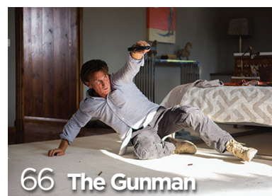
66 The Gunman