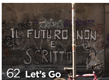
62 Let's Go