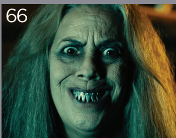
Le streghe son tornate