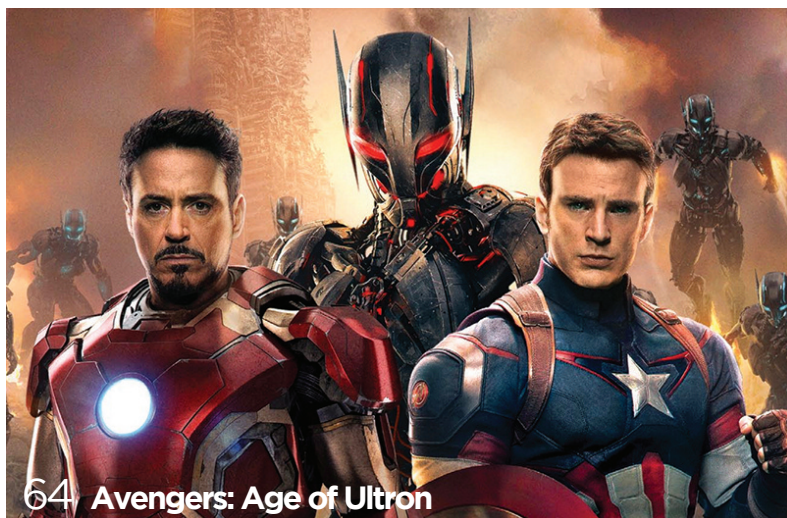
64 Avengers: Age of Ultron

★★★★ OTTIMO ★★★ BUONO ★★ SUFFICIENTE ★ MEDIOCRE ★ SCARSO