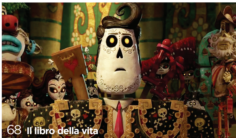
68 Il libro della vita