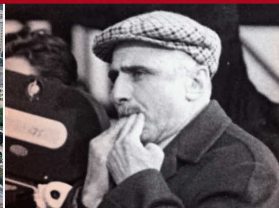
28 Monicelli: una vita sul set