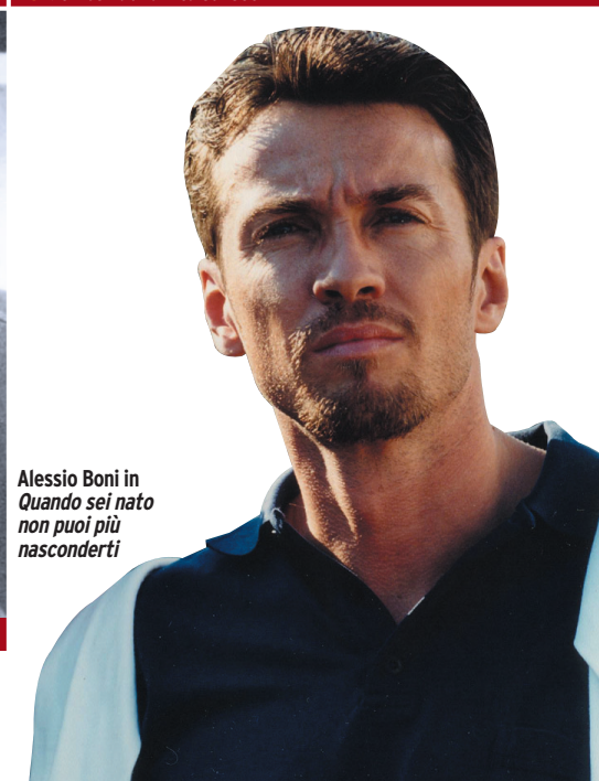
Alessio Boni in Quando sei nato non puoi più nasconderti