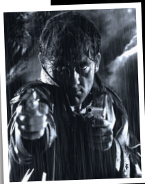
23 Natalie Portman, protagonista di Guerre stellari