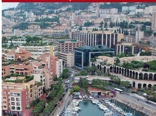
52 Cinema e letteratura a Montecarlo