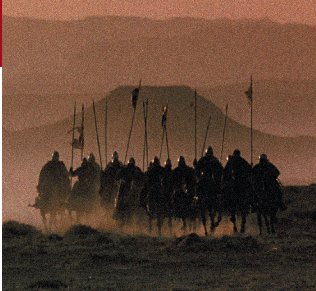
24 Le Crociate secondo Ridley Scott