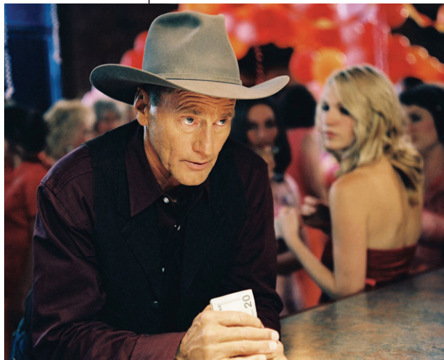
Sam Shepard in Don't Come Knockin' di Wim Wenders