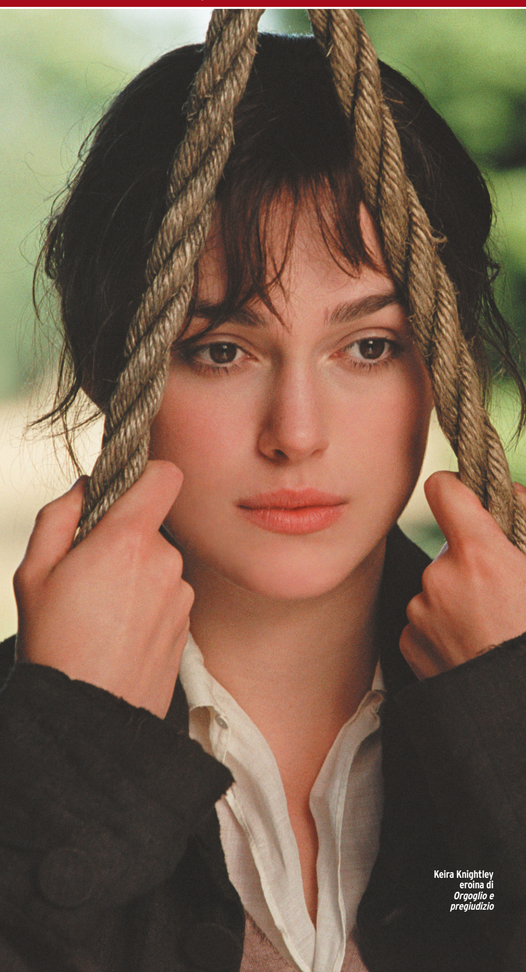
Keira Knightley eroina di Orgoglio e pregiudizio