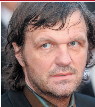
Emir Kusturica, l'enfant terrible