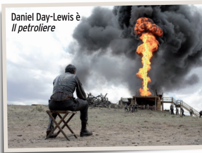
Daniel Day-Lewis è Il petroliere

Ancora in corsa per una statuette, il nostro Giuseppe Tornatore con La sconosciuta : non dovesse entrare nella cinquina delle nomination a miglior film straniero, conferma comunque la sua caratura internazionale. Da Hollywood all'Italia, destinazione Rivista del Cinematografo : il più antico periodico del settore italiano compie 80 anni. Ne vedrete – e leggerete – delle belle: è una promessa. Come sempre, la nostra tradizione è l'innovazione.