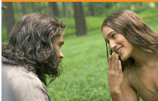
17 La rivelazione The New World