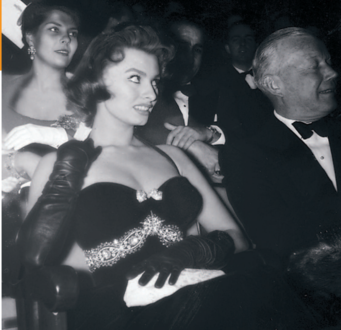
35 Cortina, 1956: la Loren alle prime Olimpiadi invernali italiane