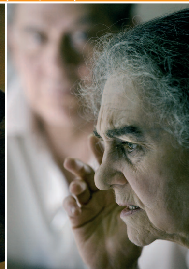
10 Golda Meir in Munich