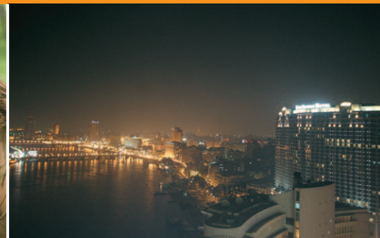
24 Il Cairo: reportage da un paese in grande fermento