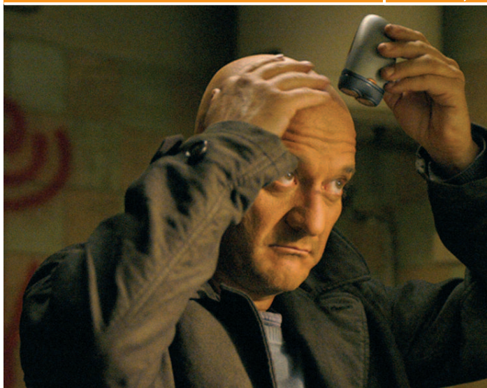
22 Dr. Bisio & Mr Hyde: metà Socio, metà Gorilla