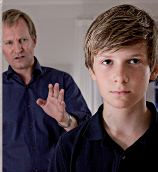
In un mondo migliore di Susanne Bier. A sinistra il regista Victor Erice