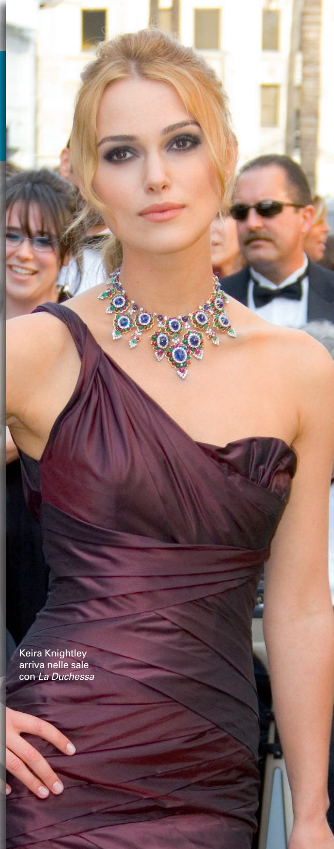
Keira Knightley arriva nelle sale con La Duchessa