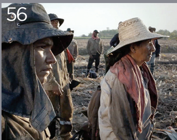
56 Un mondo fragile