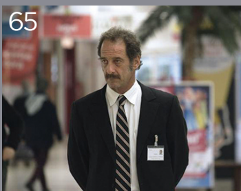
65 La legge del mercato