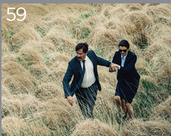
59 The Lobster