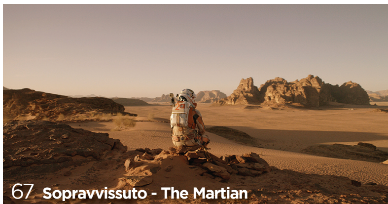
67 Sopravvissuto - The Martian